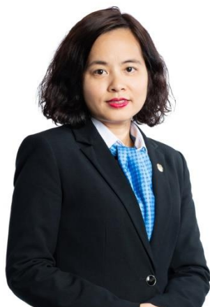
Bà Thân Hi n Anh Ch t ch H TV/Chairperson